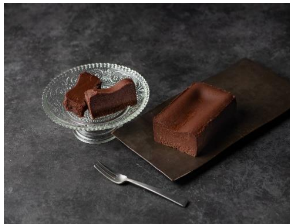
▲ルナイエナ (奈良県) の～栄養士の手作り～しあわせ感じる 大人のガトーショコラ