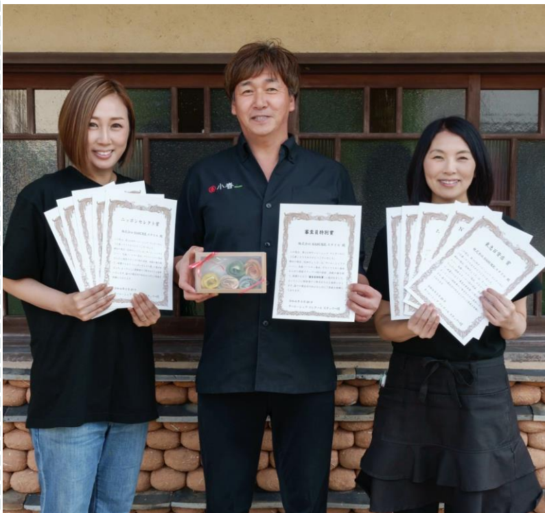
▲株式会社 SASUKE.スタイル (大分県) の皆さん

2021年度の本取組みに参加し、文春マルシェ、大丸松坂屋百貨店、フェリシモから賞や紹介希望を受け、取引に繋がりました。その後、2022年に第12回チーム・シェフコンクールに参加され、賞を2社(久世福商店など)、紹介希望を5社(紀ノ国屋、西日本旅客鉄道など)、また審査員特別賞を受賞するなどの成果に繋がりました。