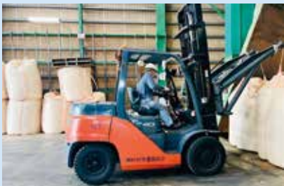
▲フォークリフトで原料を搬入します