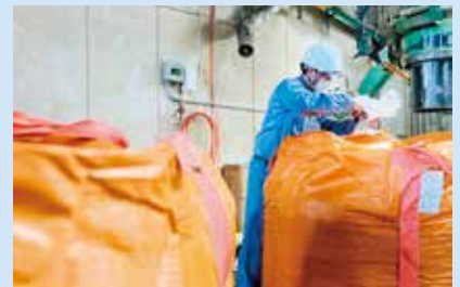
▲できあがった飼料を梱包します