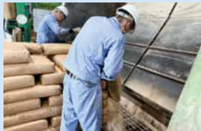
▲指示書に合わせて原料を投入します